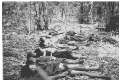
Militärjuntan i Burma bedriver etnisk rensning i vissa områden i Burma samtidigt som oljebolagen berikar sig på förtrycket (Foto från Karen Human Rights Watch).

Total Oil:s verksamhet har också kopplats till brott mot de mänskliga rättigheterna såsom, tvångsflyttning, barnarbete, slavarbete och avrättning av oppositionella. Det är