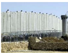
Muren i Palestina.

2008 blev ett förlorat år för den israelisk-palestinska fredsprocessen. Visserligen hölls våldsutvecklingen på en låg nivå jämfört med många tidigare år, och kontinuerliga samtal fördes mellan den palestinske presidenten Mahmoud Abbas och Israels premiärminister Ehud Olmert. Men de reella framstegen var små och man får anstränga sig ordentligt för att i dag se några ljus i tunneln.