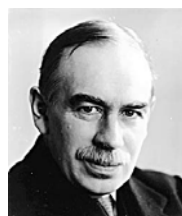
John Maynard Keynes

När den amerikanska bolånekrisen exploderade kom det inte som en överraskning för den som åtminstone hjälpligt följt den ekonomiska utvecklingen. Men när den väl var ett faktum var högerns tankesmedjor, i USA såväl som i Sverige, snabbt ute och förklarade i artiklar och rapporter, att den skyldige egentligen är staten som lagt sig i för mycket. Vänstern däremot, den höll nästan tyst.